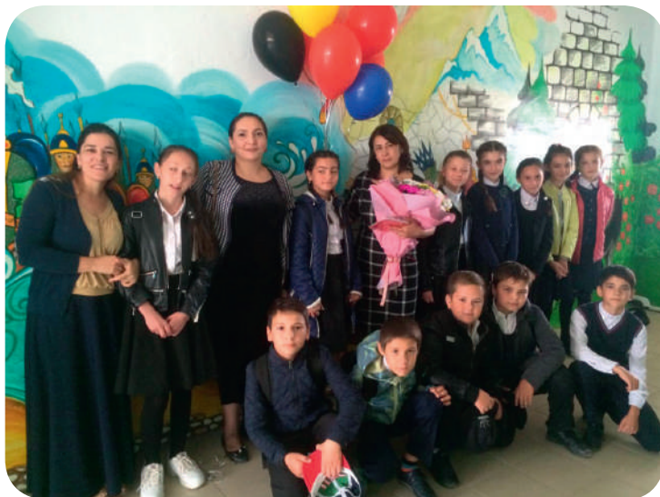
С поздравлениями на День Учителя.