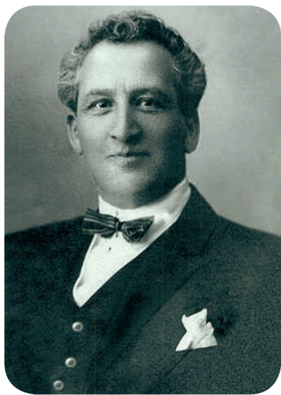
Коркмасов, Джелал-эд-Дин Асельдерович (1877-1937)