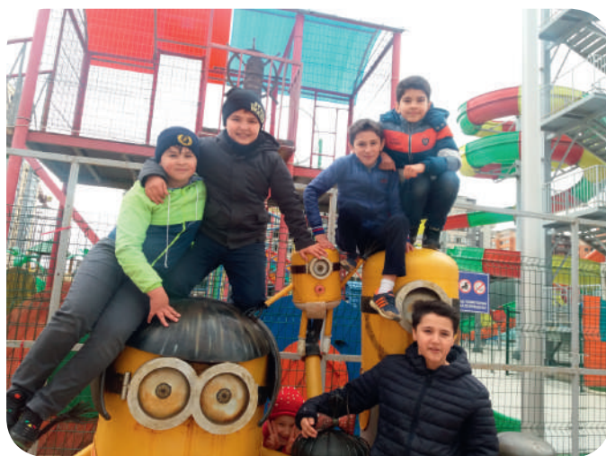
В парке «Анжи арена»