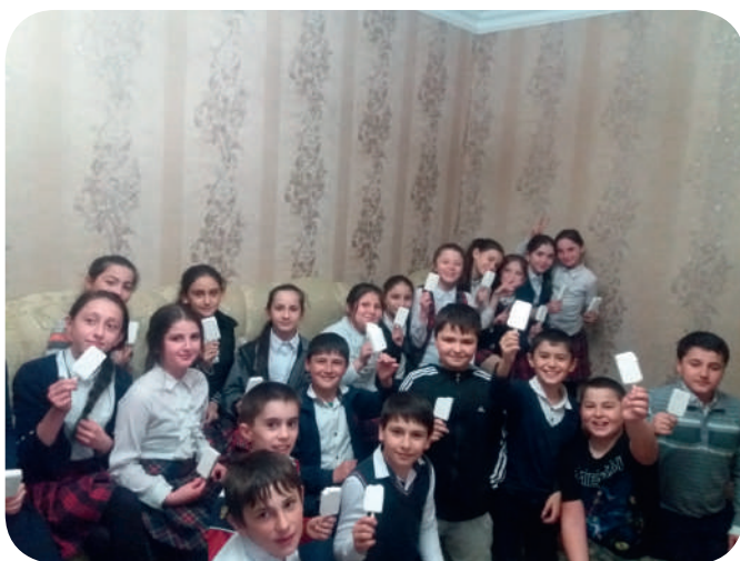
В гостях у Динислама.