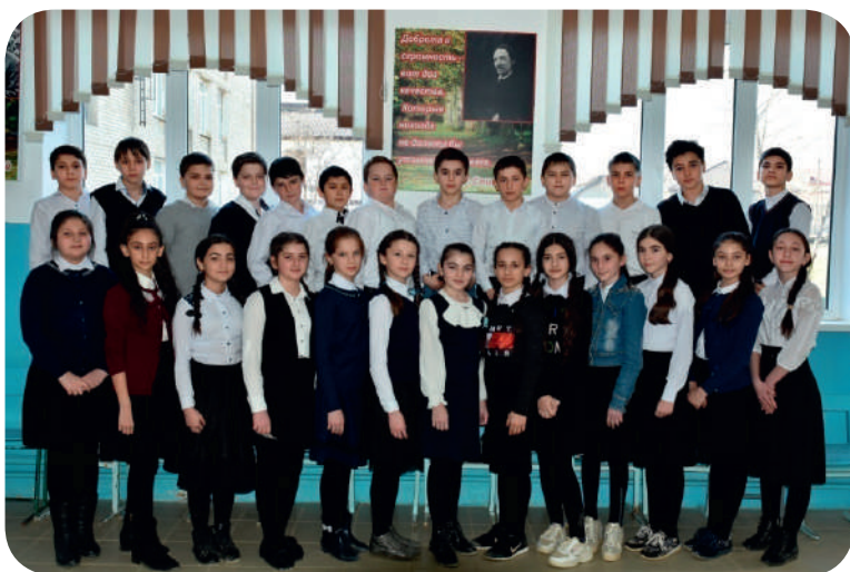
Самый лучший в мире класс!