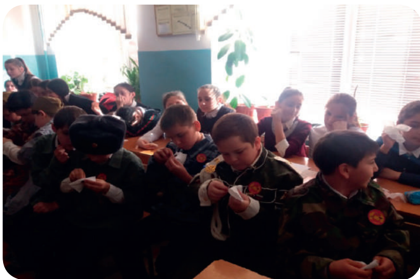
Пуговицы в ряд.