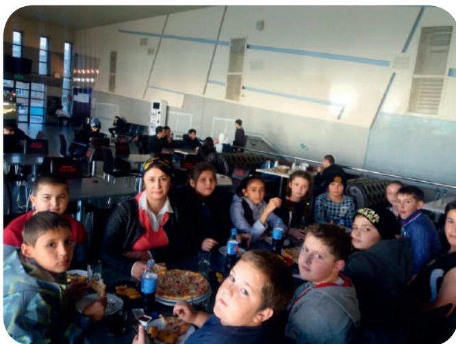
Не отвлекайте нас.