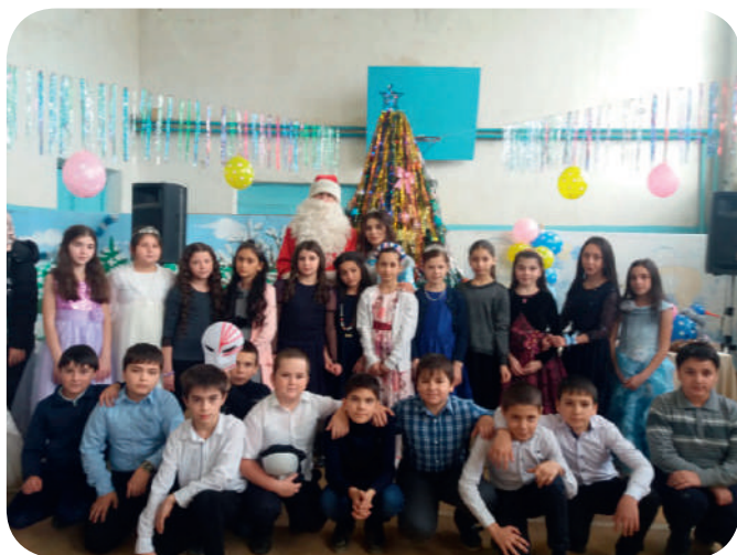
Наш любимый праздник «Новый год».