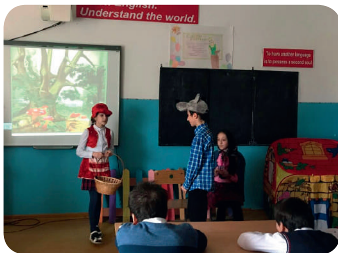
Сказка «Красная шапочка» на английском языке.