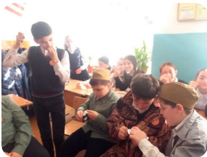
А-НУ- КА ПАРНИ