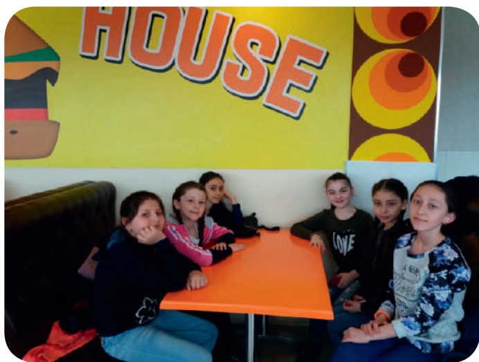
Пора бы и перекусить