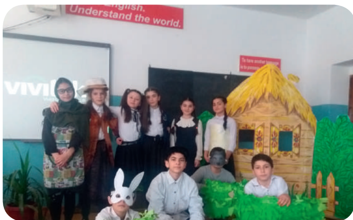
Артисты Малого Театра.