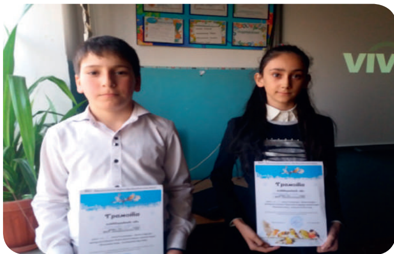
Победители конкурса «День птиц»