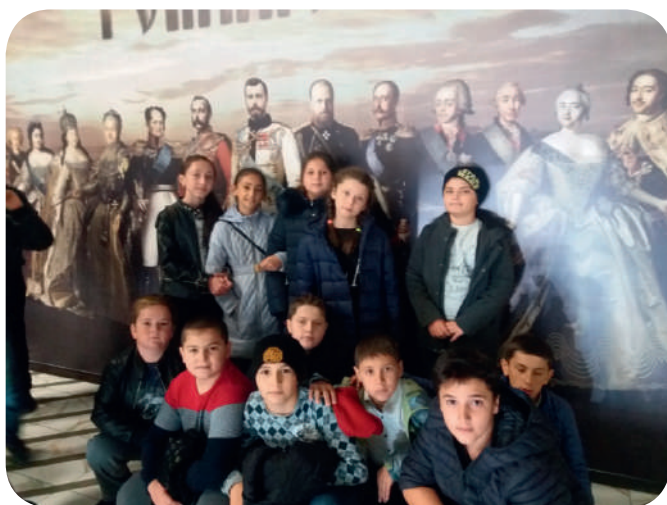
Теперь мы знаем всё о семье Романовых.