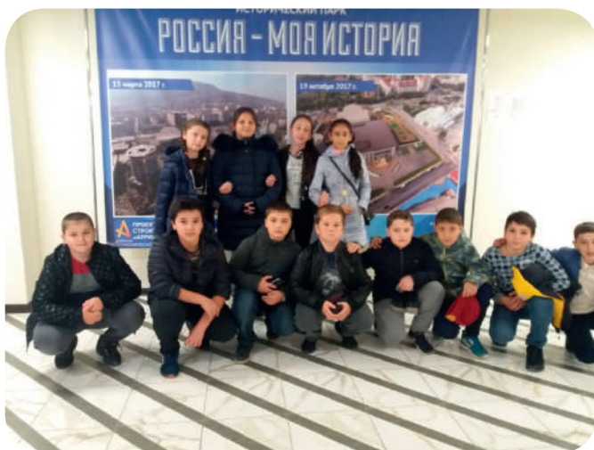
Историю должны знать все!