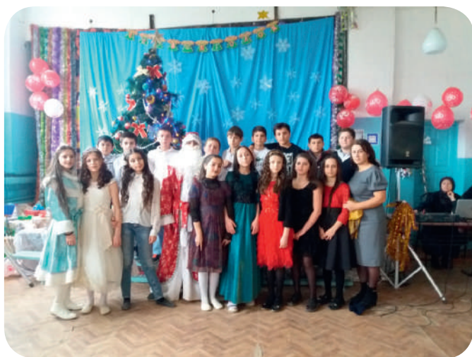
Весело, весело встретим Новый 2019